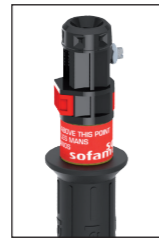
Detalle del sistema de conexión Detail of connection system Détail du système de branchement