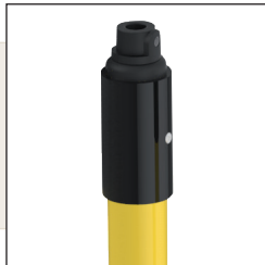
M Cabezal Métrico-10