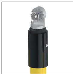
U Cabezal Universal