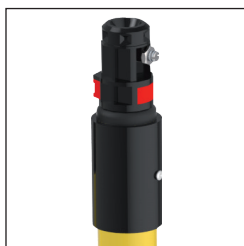
P Cabezal Polivalente (Hexagonal + Métrico-10)

Ajustadores estables Tubo de fibra de vidrio reforzado hasta 12 m