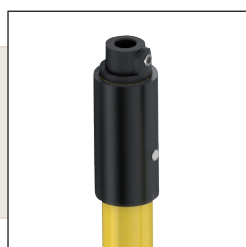
M Cabezal Métrico-10

Pértigas de dos tramos telescópicos realizadas con tubo de poliéster y fibra de vidrio de Ø 37 y de Ø 32 mm. Con obturaciones antihumedad en ambos extremos, guardamanos, empuñadura, contera y cabezal: M (Métrico-10), U (Universal), B (Bayoneta), P (Polivalente).