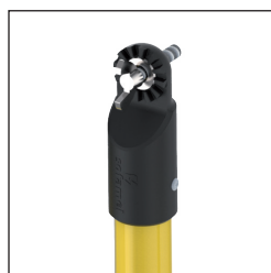
U Cabezal Universal