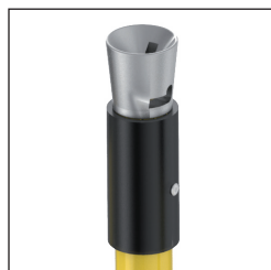
B Cabezal Bayoneta