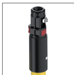
P Cabezal Polivalente (Hexagonal + Métrico-10)