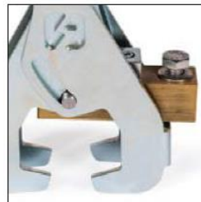
TTSR Torno de tierra