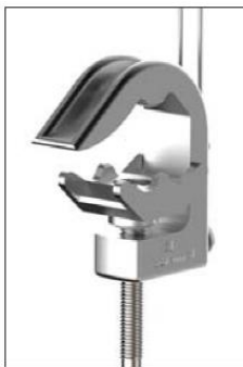
PC Pinza de media tensión

Equipo de puesta a tierra unipolar para líneas de catenaria de sistemas ferroviarios con pinza PDC que permite la conexión a tierra de las líneas durante las operaciones de reparación y mantenimiento.