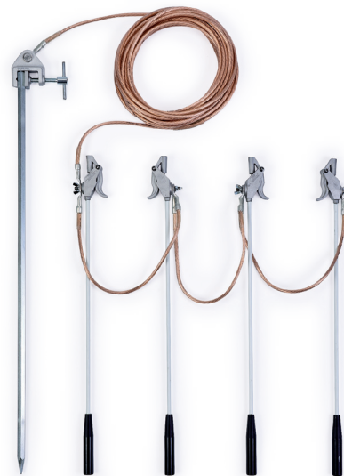
Detalle del sistema de conexión Detail of connection system Détail du système de branchement