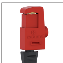
SHUNT SHCD Y SHUNT SHPL Pinza aislada

Equipo de puesta a tierra y cortocircuito para cuadros eléctricos de baja tensión. El objetivo principal de su instalación es la protección del trabajador ante la puesta en funcionamiento accidental o un posible retorno de tensión durante los trabajos de reparación. Conforme a la norma IEC 61230.