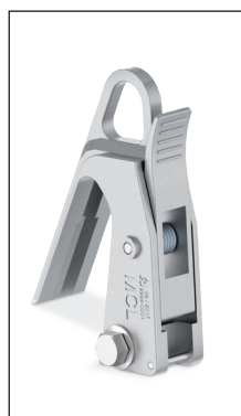
MCL Pinza de media tensión