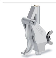
PEBT Pinza de baja tensión