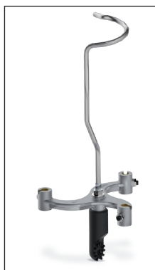
PP-3U Plato portapinzas