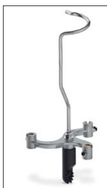
PP-3U Plato portapinzas