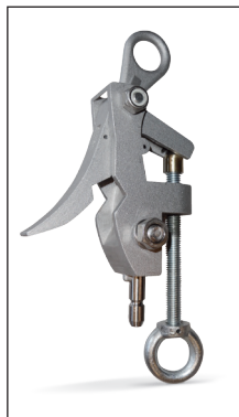
PCA-25 Pinza de media tensión