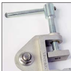
TT-38A Torno de tierra