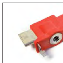
NH1-3 Cuchilla seccionadora y de puesta a tierra