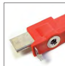
NH00 Cuchilla seccionadora y de puesta a tierra