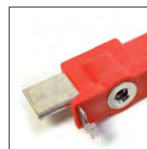
NH00 Cuchilla seccionadora y de puesta a tierra