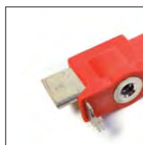
NH1-3 Cuchilla seccionadora y de puesta a tierra