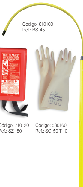
Código: 610100 Ref.: BS-45