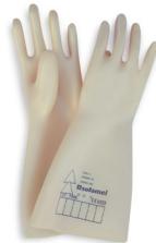
Código: 530160 Ref.: SG-50 T-10