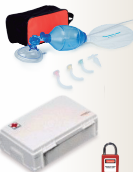
Código: 700110 Ref.: SZ-06