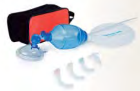
Código: 695100 Ref.: SZ-02