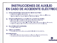
Código: X690165 Ref.: SZ08 E