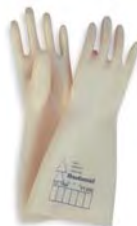
Código: 530270 Ref.: SG-30