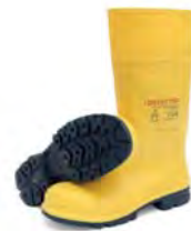
Código: 715160 (Talla 43) Tallas disponibles: 42-45 Ref.: DB2 T43