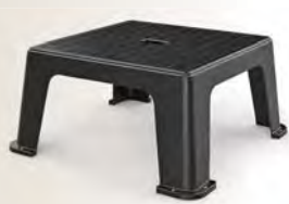
Código: 580155 Ref.: STM-45