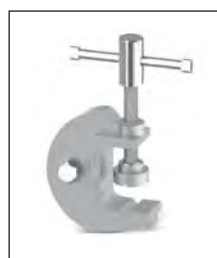
TT-50 Étau de mise à terre