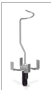
PP-3U MCL Tête dispensatrice de pincés