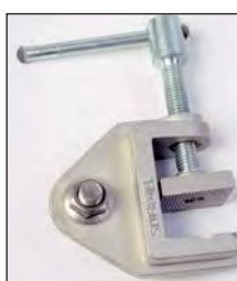
TT-38A Étai de mise à terre