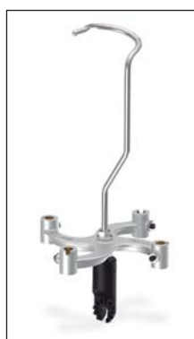
PP-4U Tête dispensatrice de pinces