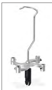
PP-4U Tête dispensatrice de pinces