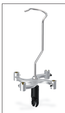
PP-4U Tête dispensatrice de pinces