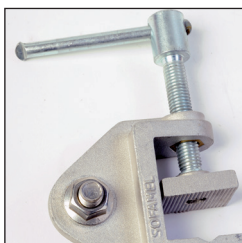
TT-38A Étau de terre