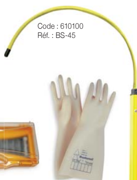
Code : 610100 Réf. : BS-45