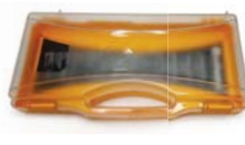
Code : 545115 Réf. : CGS