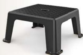
Code : 580155 Réf. : STM-45

Produit fourni avec vis et clous (à suspendre).