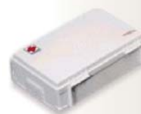
Trousse à pharmacie Réf. : SZ-06 Code : 700110