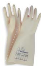
Gants diélectriques Réf. : SG-50 T-10 Code : 530160