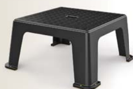
Tabouret isolant Réf. : STM-45 Code : 580155

Produit fourni avec vis et clous (à suspendre).