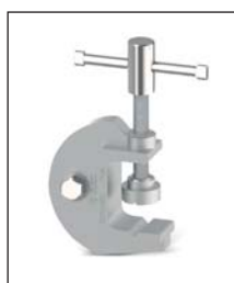
TT-50 Étai de mise à terre