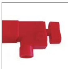
PTA Morsetto isolato