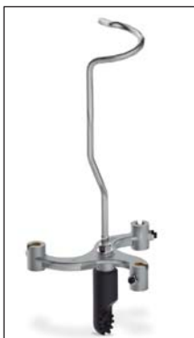
PP-3U Piattello portapinze