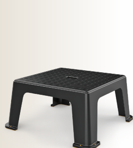
Codice: 580155 Rif.: STM-45