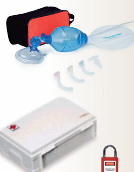
Codice: 700110 Rif.: SZ-06