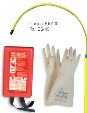
Codice: 610100 Rif.: BS-45