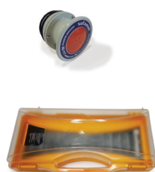
Codice: 545115 Rif.: CGS