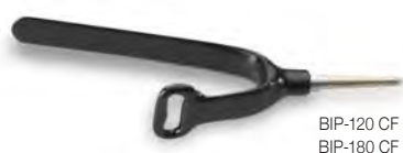
BIP-120 CF BIP-180 CF

Il passacavo serie BIP è realizzato in acciaio inox plastificato. Non sono richiesti altri attrezzi per il fissaggio. Possono essere riutilizzati più volte. Sono specifici per cavi e connessioni.