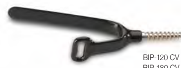
BIP-120 CV BIP-180 CV