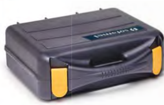
Matrizes a utilizar