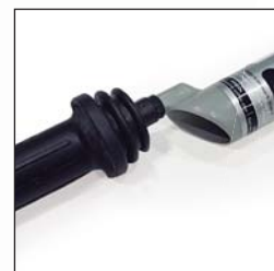
Detetor com a vara recolhida.