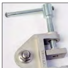
TT-38A Pinça de ligação à terra